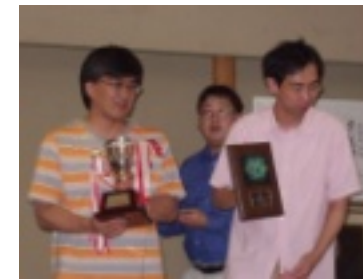
この面の写真は社団戦一部リーグの熱戦の様相です。

るも、他に星がかせげずチームとしては2勝2敗。二日目、エトス桜庭が都合により休場。リリーフエトス次回に期待・みずならチーム